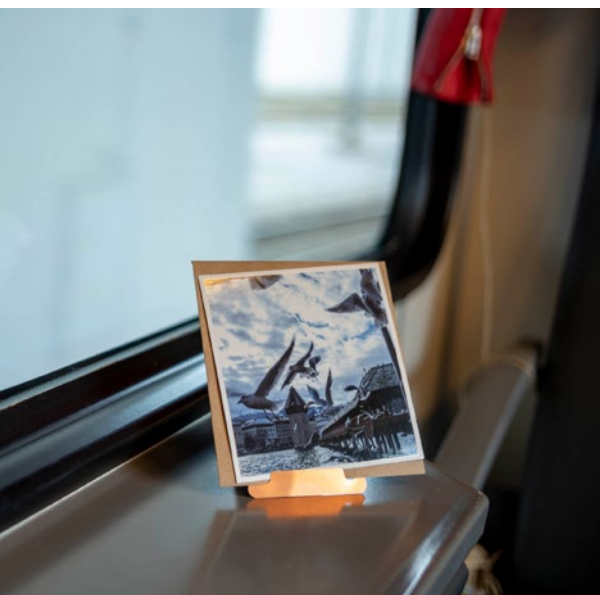
scharfsinniger Kartenhalter für besondere Momente.